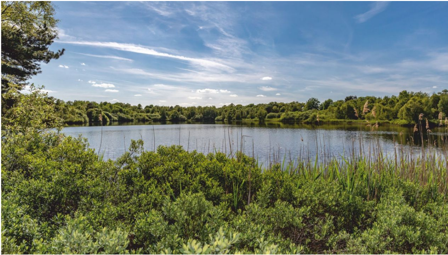
Heiliges Meer bei Ibbenbüren