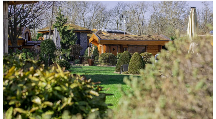
H2O-Saunagarten-Freizeiteinrichtungen Stadtwerke Herford GmbH-R-Stachura.jpg