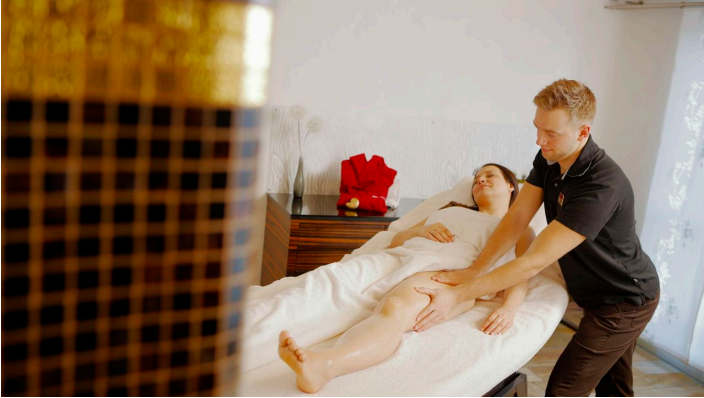
H2O-Refugium_2016_012-Freizeiteinrichtungen Stadtwerke Herford GmbH-Th-Ulonska.jpg