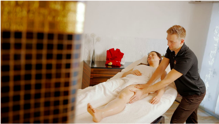
H2O-Refugium_2016_012-Freizeiteinrichtungen Stadtwerke Herford GmbH-Th-Ulonska.jpg