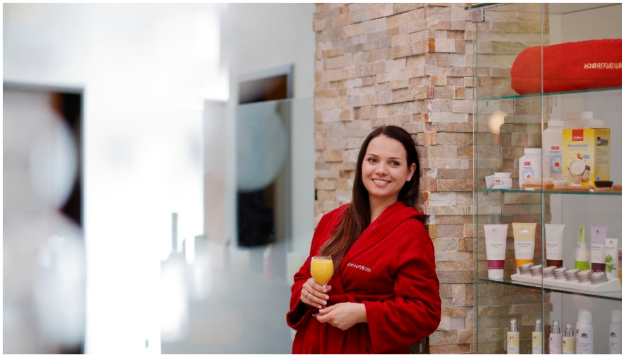
H2O-Refugium_2016_004-Freizeiteinrichtungen Stadtwerke Herford GmbH-Th- Ulonka.jpg