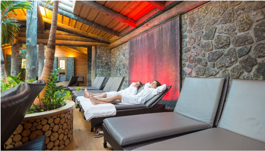
Teutoburger Wald-2015-Wellness-001-Teutoburger-Wald-Tourismus-D-Ketz.jpg