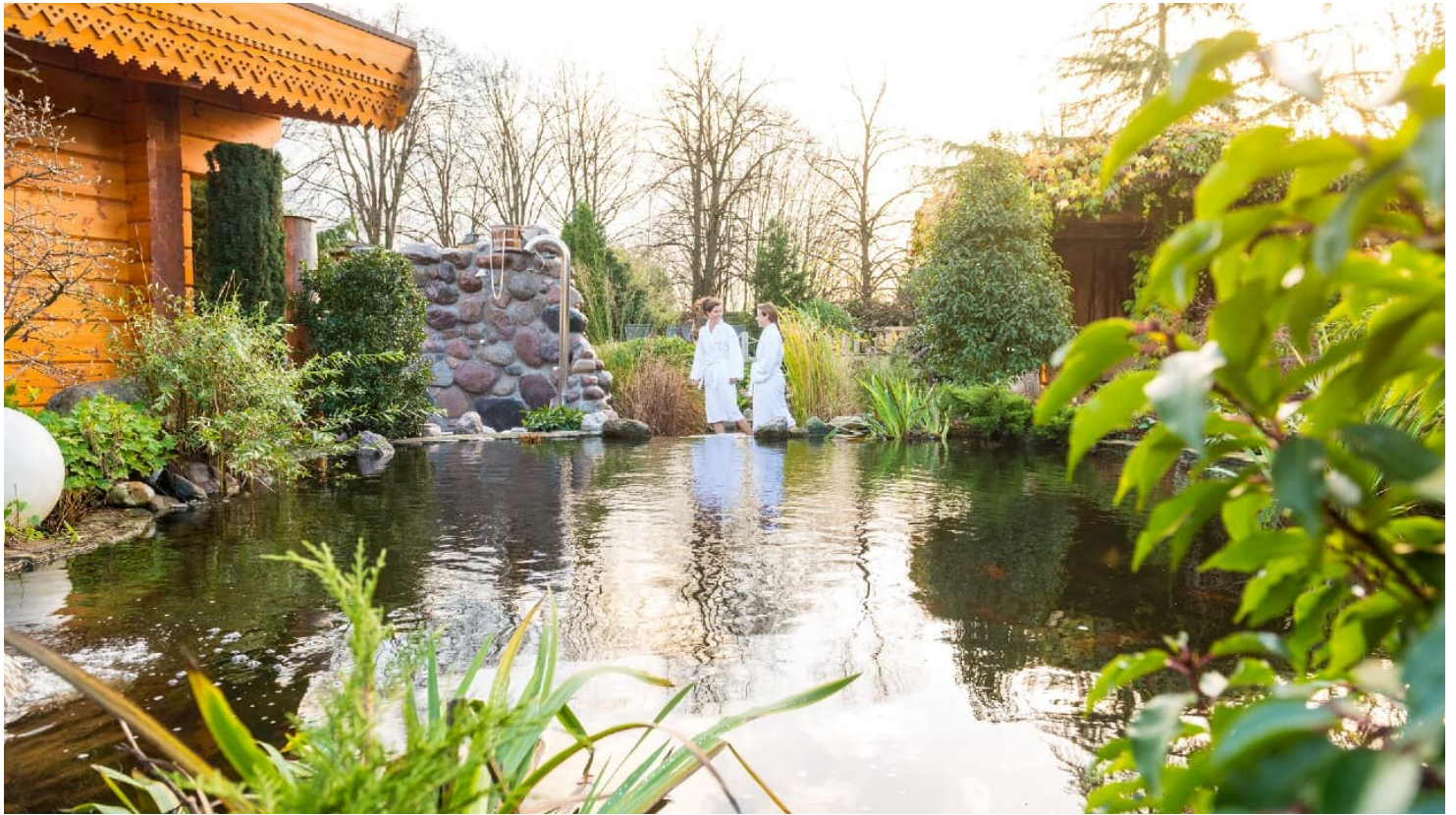
Teutoburger Wald-2015-Wellness-013-Teutoburger-Wald-Tourismus-D-Ketz.jpg