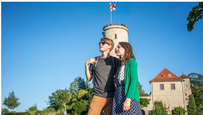
Sparrenburg in Bielefeld