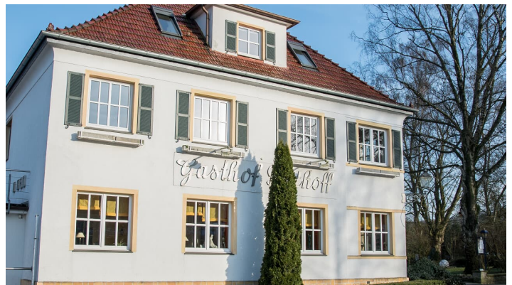
Gasthof Potthoff