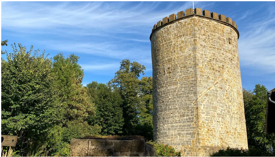
Burg Ravensberg in Borgholzhausen