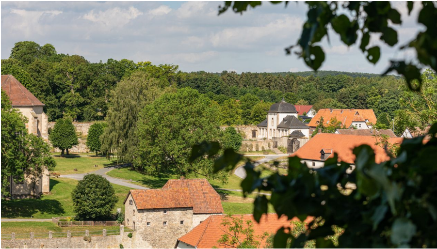
Lichtenau-Kloster-Dalheim-Teutoburger-Wald-Tourismus-M-Schoberer (3).jpg