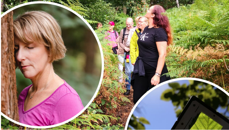
Waldbaden (Shinrin Yoku)