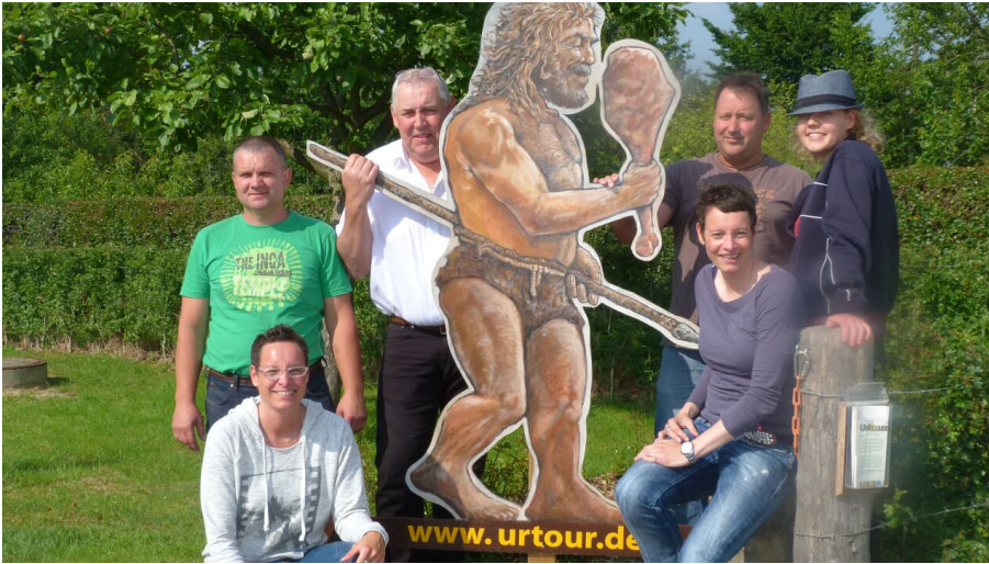
Mit der Urtour unterwegs im Neandertal - © Ute Stöcker