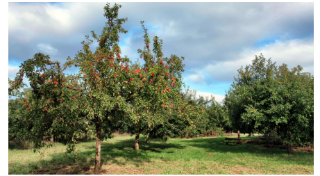
Obstwiese der Biologischen Station bei Haus Bürgel in Monheim am Rhein