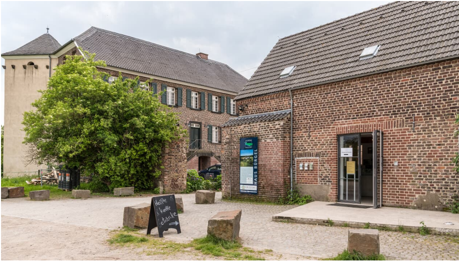
Haus Bürgel in Monheim am Rhein - © Dominik Ketz, Kreis Mettmann