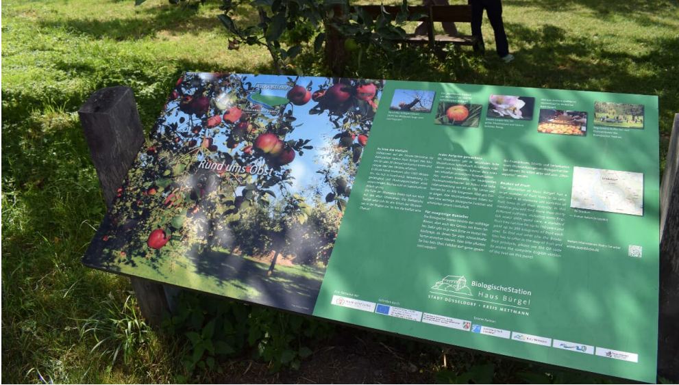
Infotafel zur Obstwiese der Biologischen Station bei Haus Bürgel in Monheim am Rhein