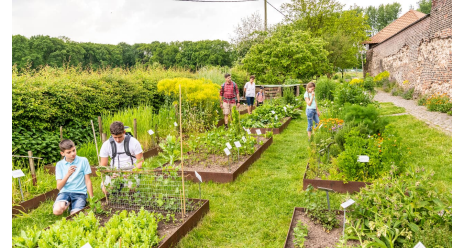
Kräutergarten der Biologischen Station von Haus Bürgel in Monheim am Rhein - © Dominik Ketz, Kreis Mettmann