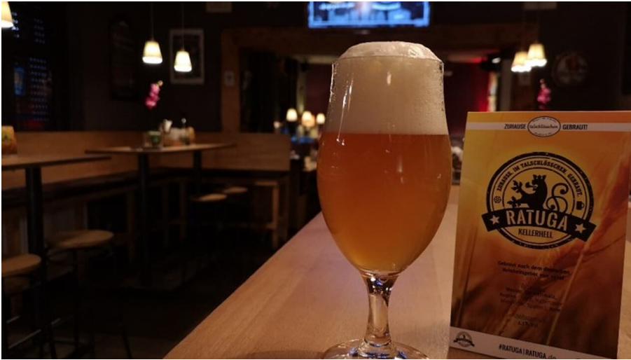
Selbstgebrautes Ratuga Bier im talschlösschen genießen, Ratingen