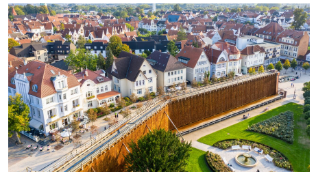
Gradierwerk in der Altstadt von Bad Salzufen