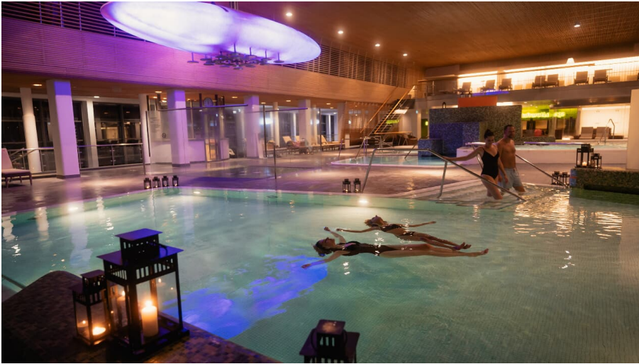
VitaSol Therme in Bad Salzuflen