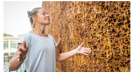
Atemerlebnis am Gradierwerk Bad Salzufen