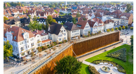
Gradierwerk in der Altstadt von Bad Salzufen