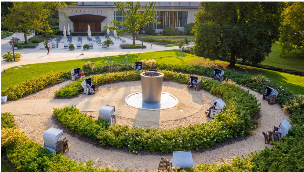
Sole-Strand im Kurpark von Bad Salzufen