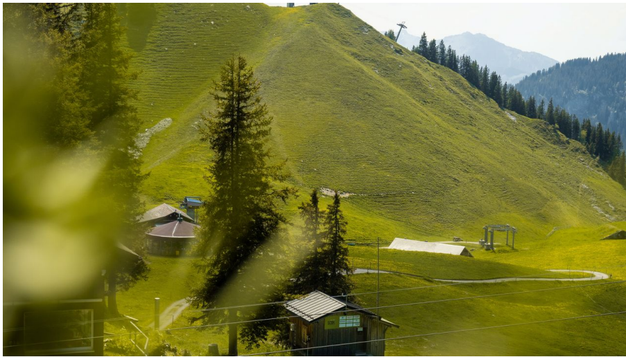
Bubble klewenalp ergglen.jpg