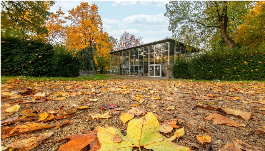
Der Schalenschneider Kotten im Herbst, Volksgarten Langenfeld