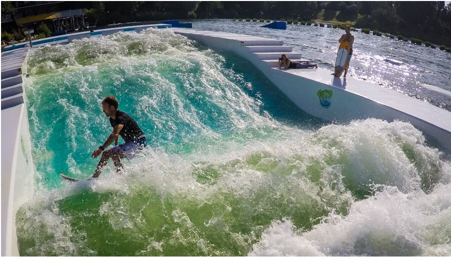
Surfing bei Wasserski Langenfeld