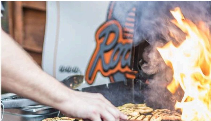
Feuriger Grillkurs im Road Stop, Mettmann