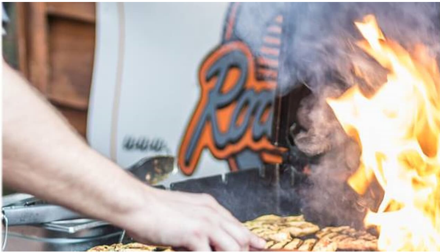
Feuriger Grillkurs im Road Stop, Mettmann