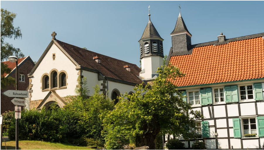
Abtskücher Kapelle St. Jakobus und Hof in Heiligenhaus