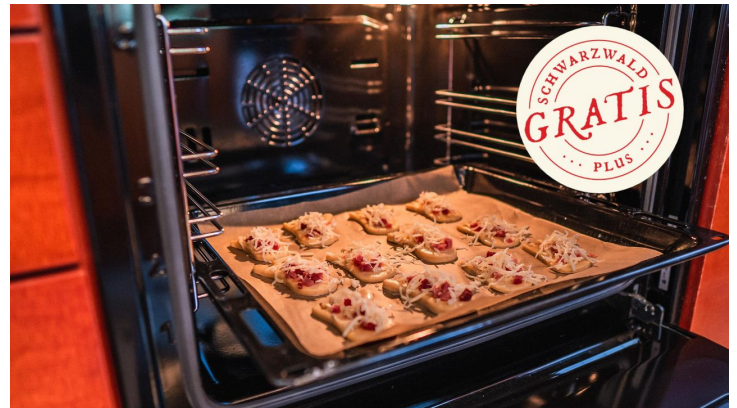
Die Käsefüße kommen in den Ofen