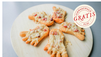
Schwäbische Käsefüße - © Bayersbronn Touristik/ Max Günter