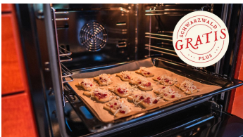
Die Käsefüße kommen in den Ofen