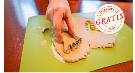
Den Teig ausstechen - © Bayersbronn Touristik/Max Günter