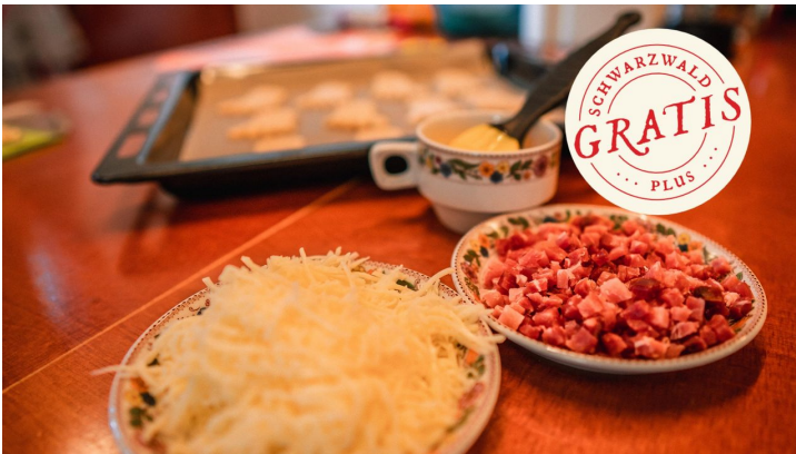
Belag für die Käsefüße