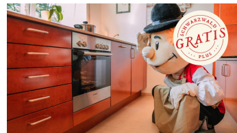
Murgel backt