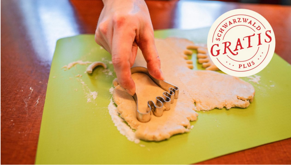
Den Teig ausstechen