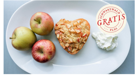
Wir backen einen Apfelkuchen