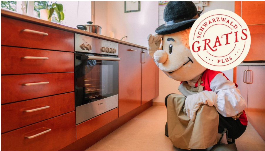
Murgel backt - © Baiersbronn Touristik/ Max Günter