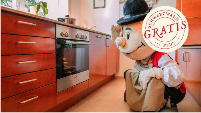
Murgel backt