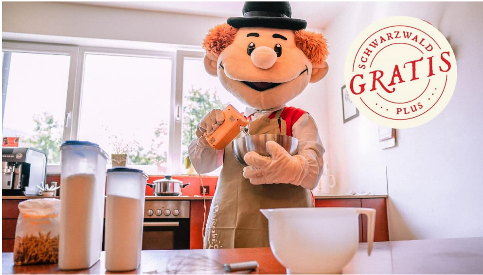
Murgel backt - © Baiersbronn Touristik/Max Günter