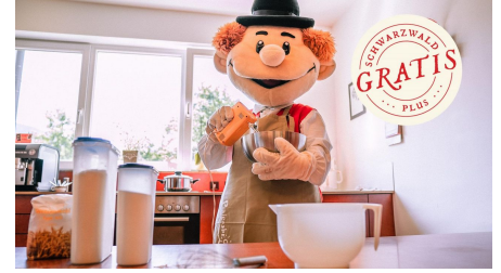
Murgel backt