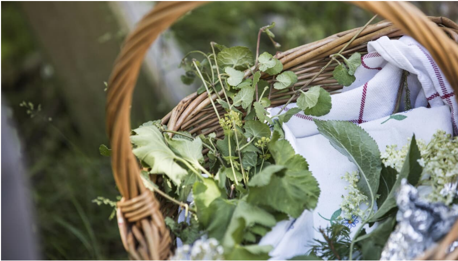
Leckere wilde Pflanzen - © Baiersbronn Touristik/Ulrike Klumpp