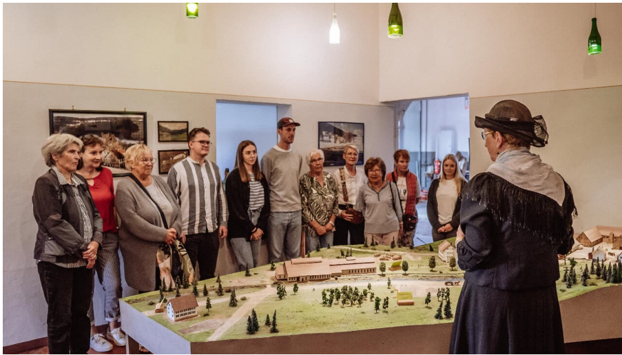
Zeitreise-Führung im Kulturpark Glashütte Buhlbach