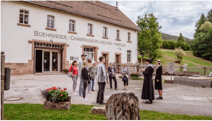
Unterwegs auf dem Gelände der Glashütte