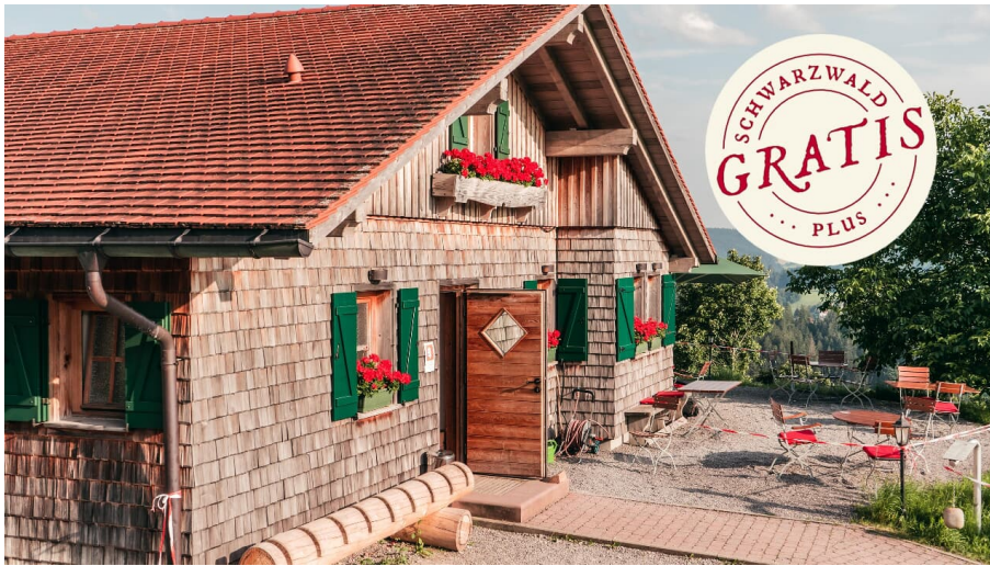
Schwarzwälder Spezialitäten Genusstour