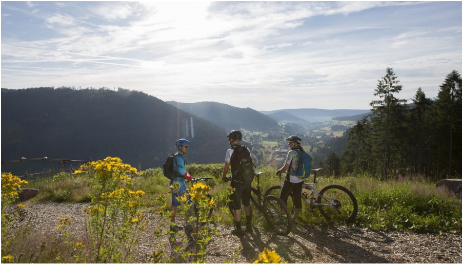
Mit Lust und Laune in die Woche