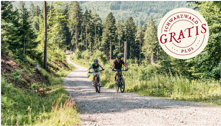
Aussichtsplattform Ellbachseeblick