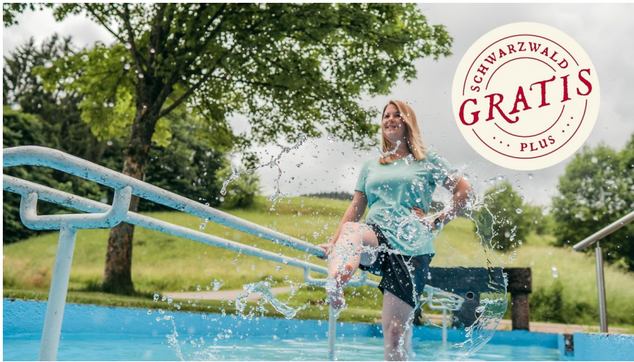
Fit durch Kneipp