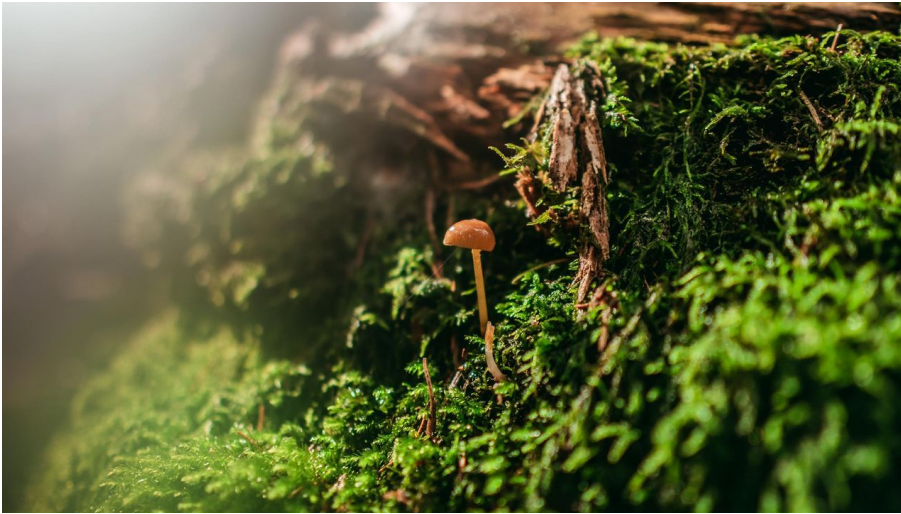
Ohne Moos nix los