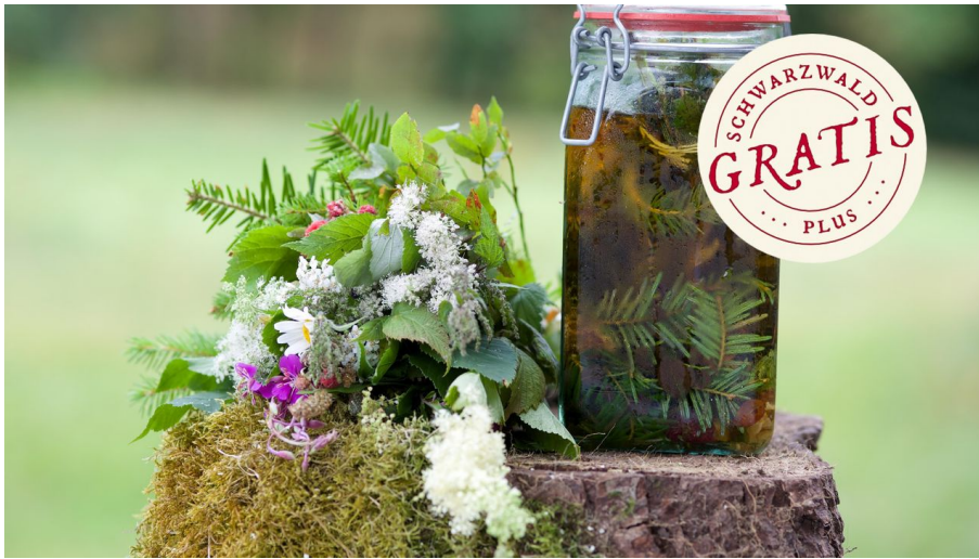
Kulinarische Wildpflanzenwanderung