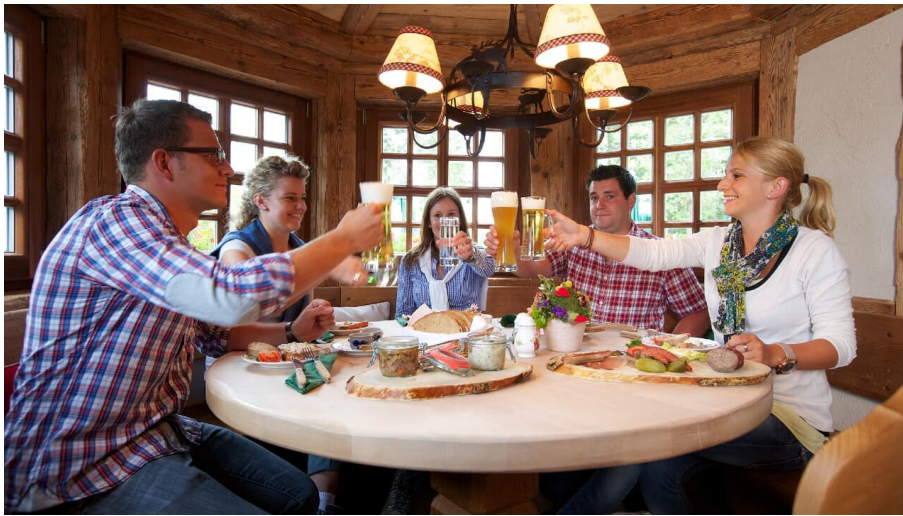
Köstlich Wandern für Gruppen