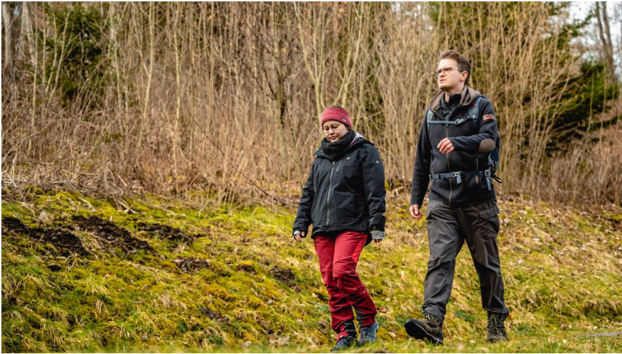
Durch den Schönegründer Königsforst