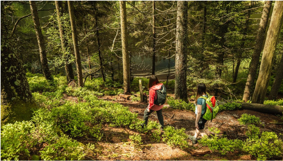
Sportlich fit in den Frühling