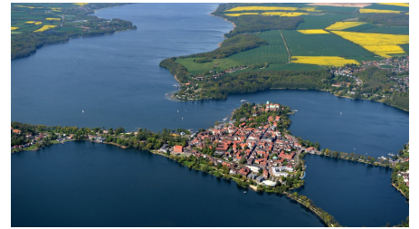
Die Inselstadt Ratzeburg aus der Vogelperspektive; Burkhard Kuhn.jpg - © FOTOFRIZZ B.KUHN , Burkhard Kuhn