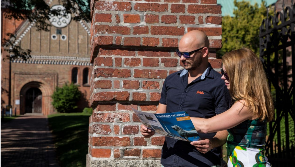
Stadtführung über die Insel, Jens Butz.jpg