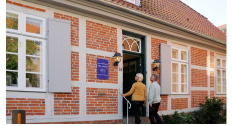
Ernst Barlach Museum in Ratzeburg, Jürgen Klemme.jpg