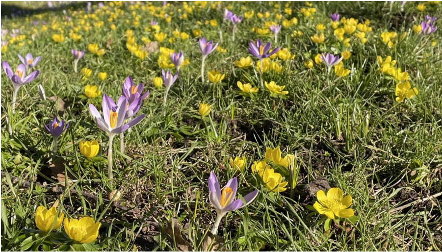
Leopold mit Blumenwiese_s.Oliveira - © Stadt Bad Salzuflen_s.Oliveira