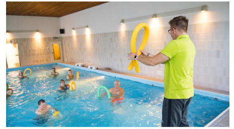
221021-FotoChristianSchwier-0146.jpg - © HolsingVital, C. Schwier