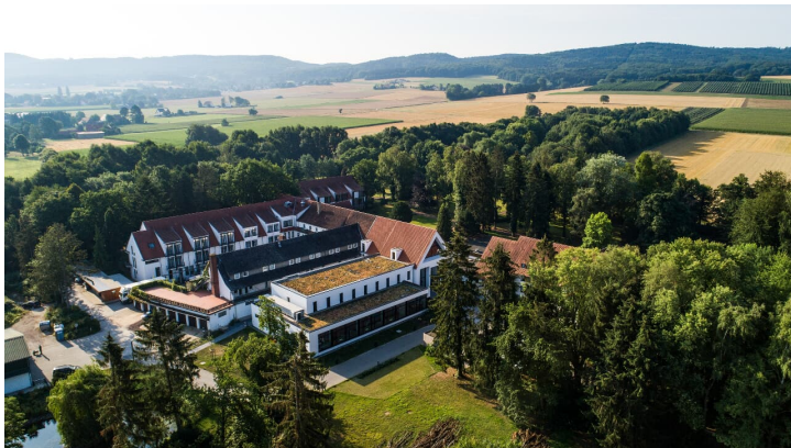
Teutoburger Wald_Preussischer Oldendorf_Reha Klinik_0109 -© Tourismus NRW e.V. (A1).JPG - © Tourismus NRW e.V.