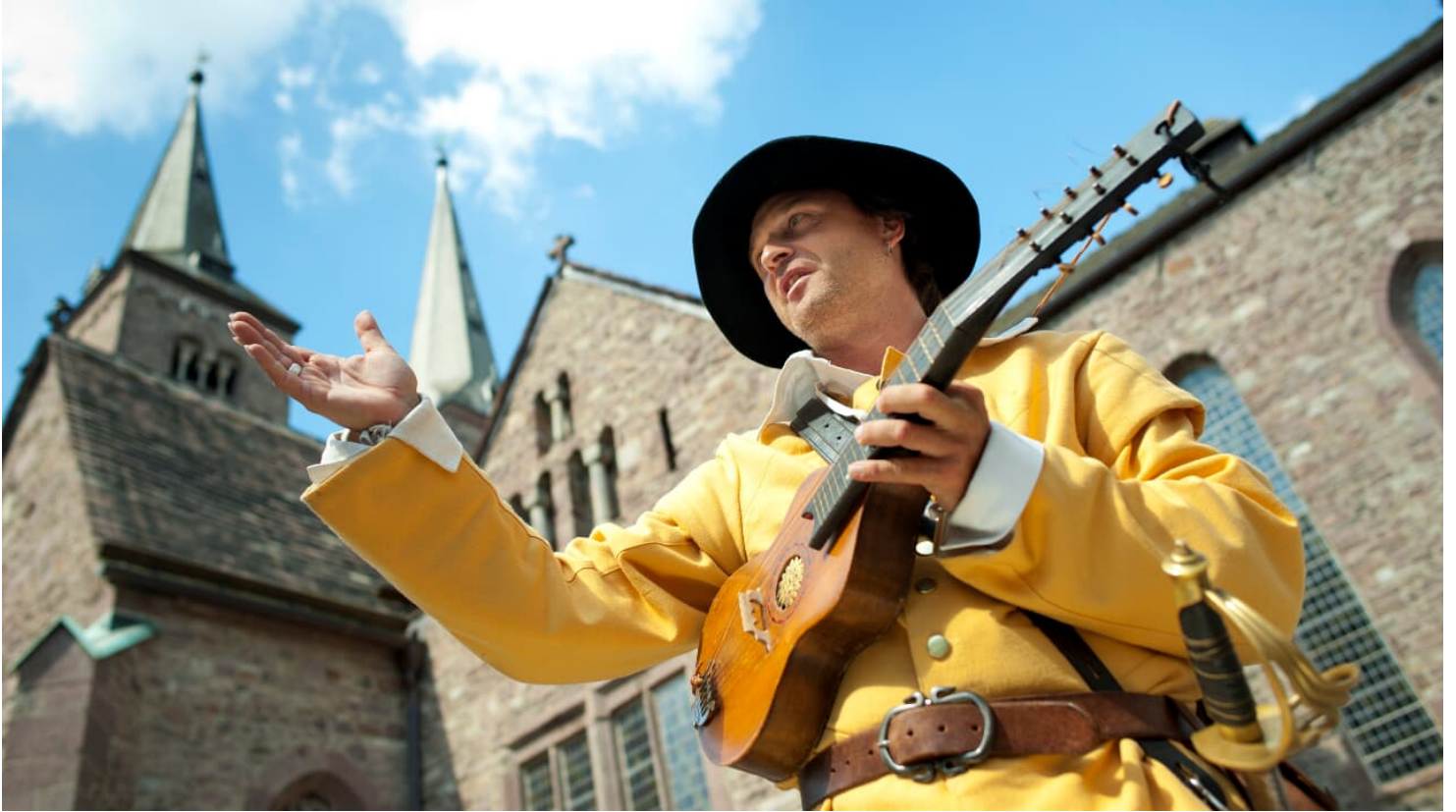
hx-jostziegenhirt-andreashub (4).jpg