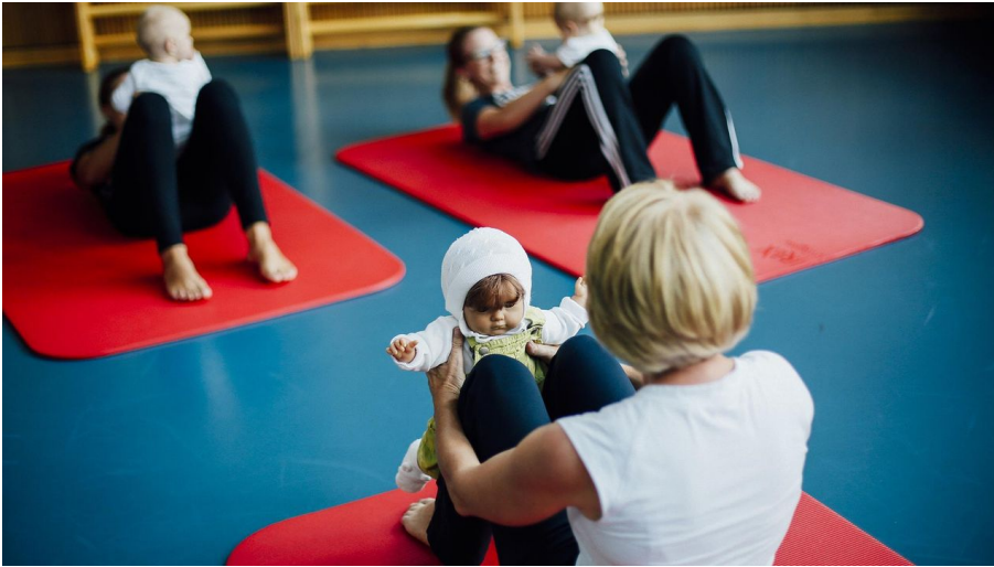
Staatsbad Salzuflen_VZ Babygymnastik_2 - © Staatsbad Salzuflen GmbH / S.Strothbäumer