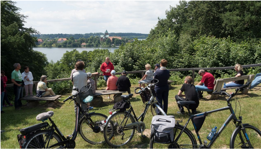
Fahrrad-Grenztour, Fotograf Gert Hüfner.jpg - © Gert Hüfner