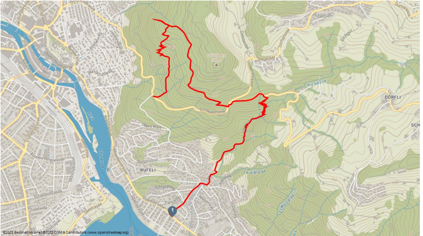
©2022 destination one | ©2022 OSM & Contributors (www.openstreetmap.org)