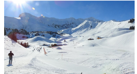
Start auf Undere Elsigle