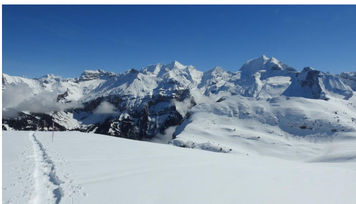
Mit jedem Höhenmeter tauchen mehr wunderschöne Gipfel auf