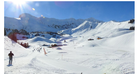
Start auf Undere Elsigle