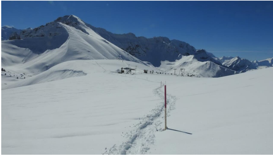
Die Skistation Homatti ist bereits passiert und es wartet der (nicht allzusteile) Aufstieg