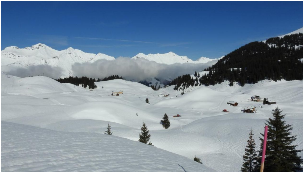
Erster Blick zurück auf Undere Elsigle mit Bergpanorama dahinter