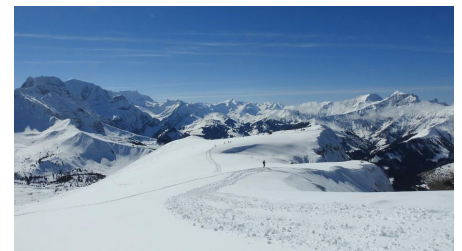
Sicht auf das Endziel vom markierten Trail, bei der Skistation. Ich stieg jedoch noch bis zum Elsighore auf...