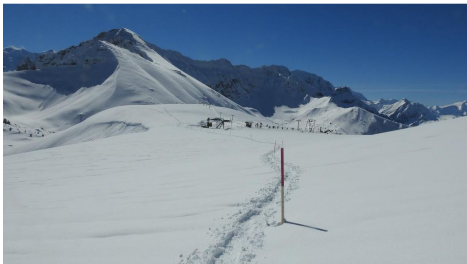
Die Skistation Homatti ist bereits passiert und es wartet der (nicht allzusteile) Aufstieg - © Simon Kiener, Community