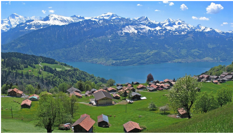
Berne Rando, Berner Wanderwege