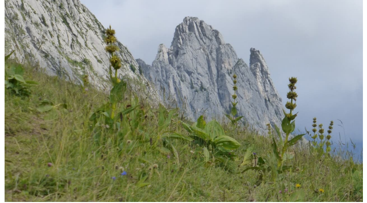
Berne Rando, Berner Wanderwege