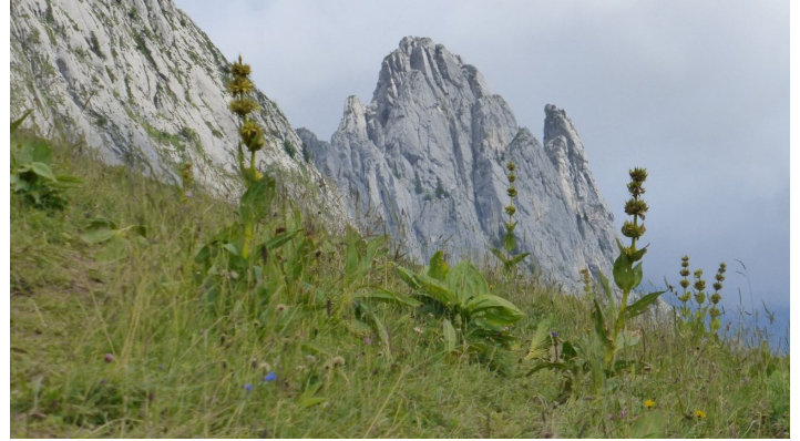
Berne Rando, Berner Wanderwege