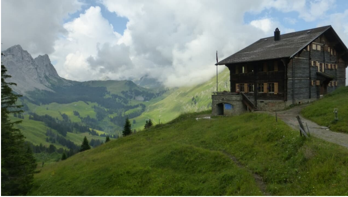
Berne Rando, Berner Wanderwege