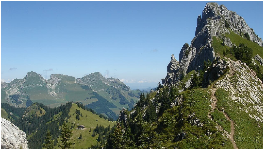
Berne Rando, Berner Wanderwege