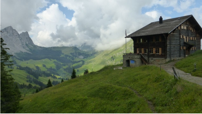
Berne Rando, Berner Wanderwege