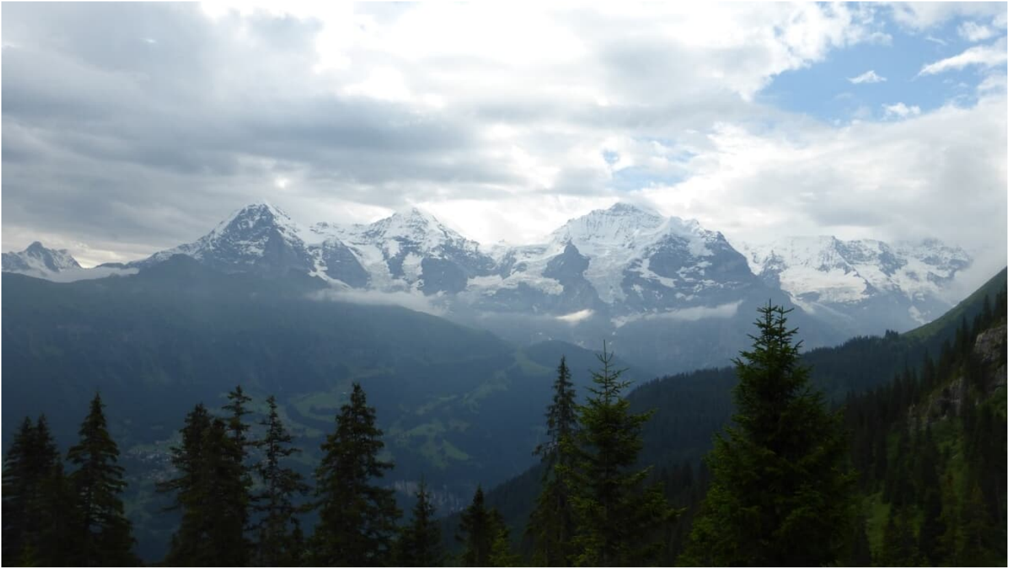
Zivil Dienst, Berner Wanderwege