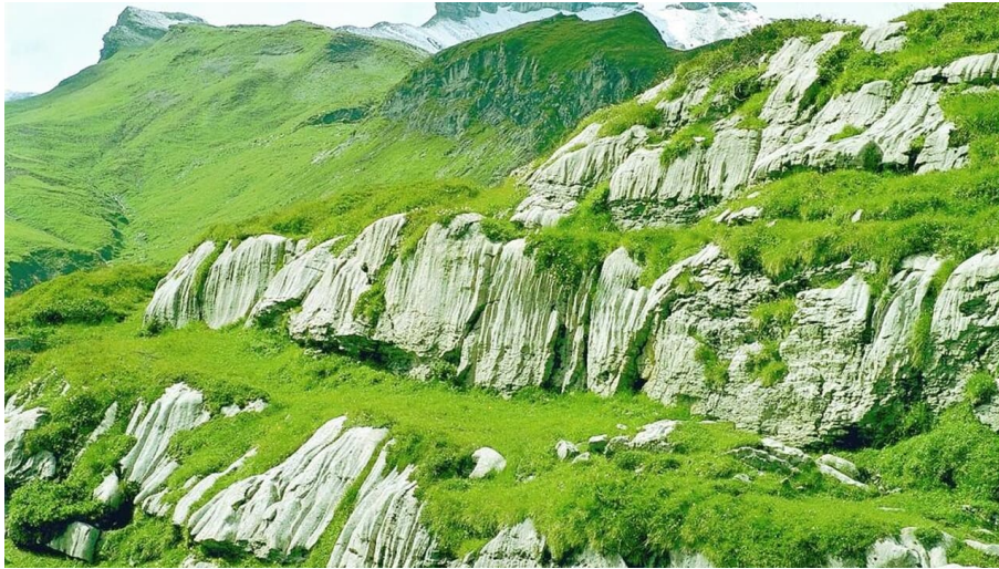
Zivil Dienst, Berner Wanderwege