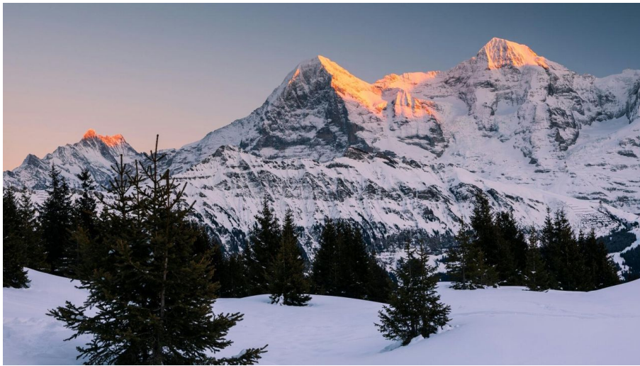
13.01.2018 Eiger und Mönch am Abend