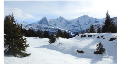
Eiger, Mönch und Jungfrau immer gegenüber