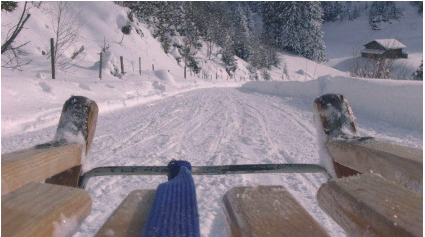
Berner Wanderwege , Berner Wanderwege