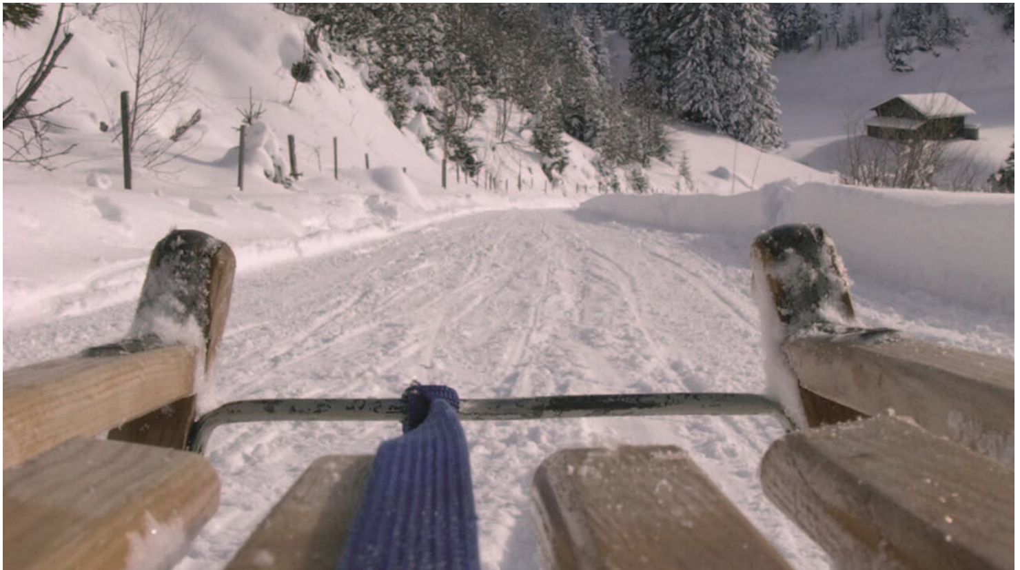
Berner Wanderwege , Berner Wanderwege