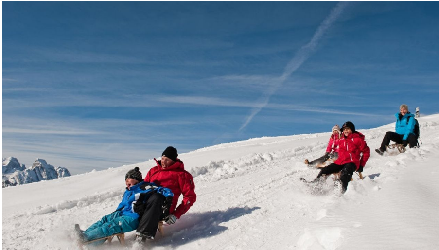
Berner Wanderwege, http://www.gstaad.ch/aktiv/winter/schlitteln-airboarden.html