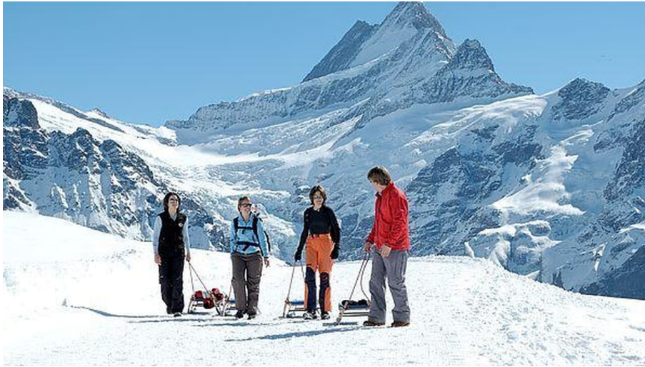
Berner Wanderwege, https://grindelwald.ch