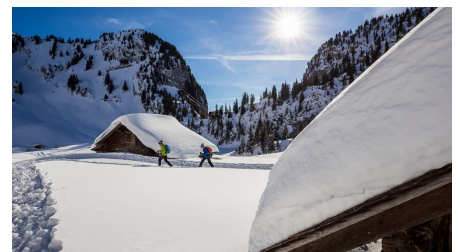
Stockhornbahn AG, Unbekannt