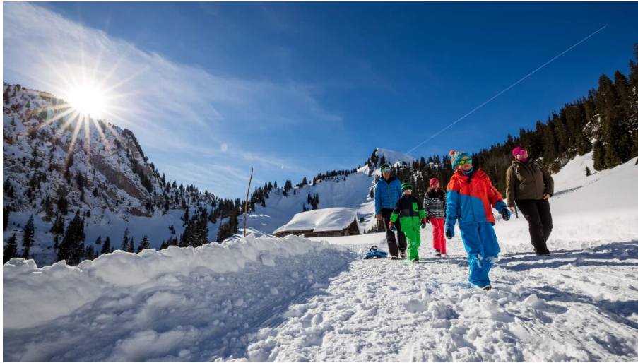
Stockhornbahn AG, Unbekannt