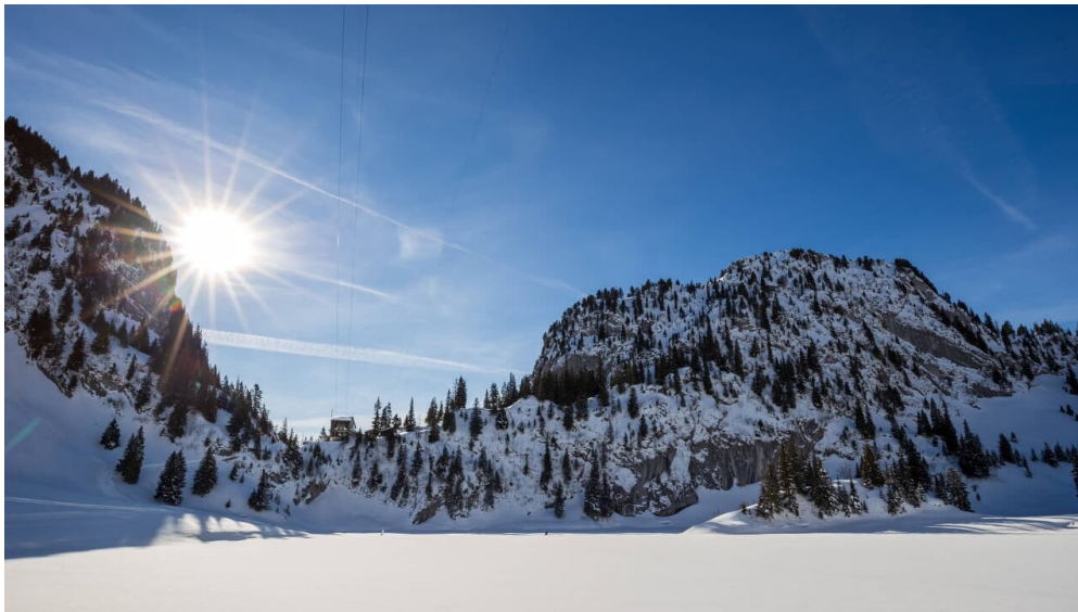
Stockhornbahn AG, Unbekannt