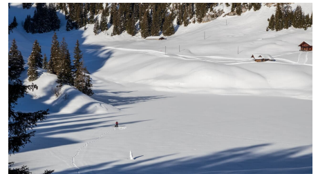
Stockhornbahn AG, Unbekannt