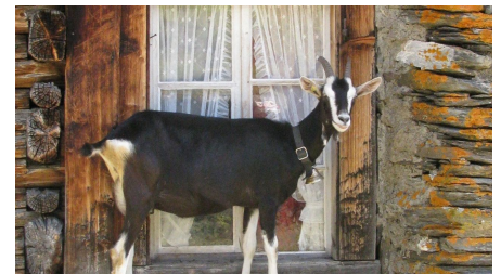
Jungfraubahnen Management AG