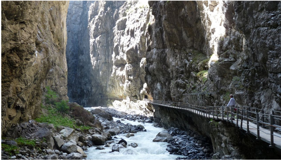
Jungfrauabfahrten Management AG