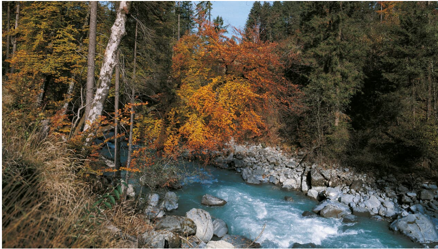
Jungfraubahnen Management AG