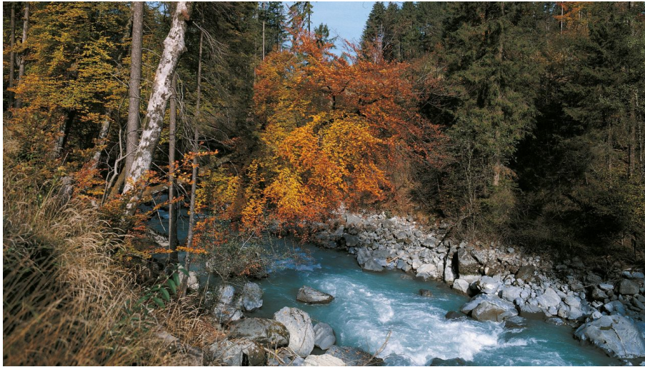
Jungfrauabnahmen Management AG